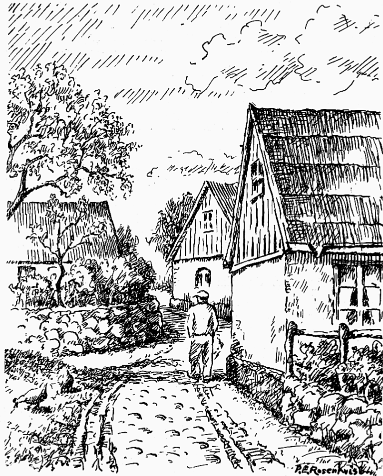
Gamla hus i Ozie.

uppe i träd Kronorna och en hackspett kommer susande i sin ryckiga flykt och slår till direkt på trädstammen som hade han klister under fötterna. En citronfjäril fladdrar i solljuset och ha vi riktigt tur, kunna vi få se den praktfulla sorgmanteln sitta på en blomma och klippa med sina svarta, guldkantade vingar. Jag gick på en räv i en grandunge strax intill Törringelund, och vi blevo lika överraskade bägge två. Han stirrade på mig några sekunder, sedan tog han ett elegant hopp in bland granarna. Sådana små överraskningar kan man leva på länge.